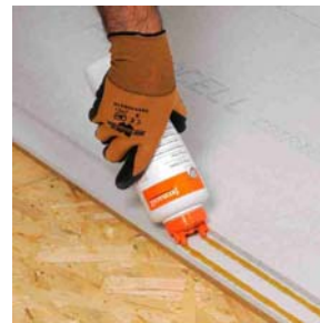
Aanbrengen van de FERMACELL Vloerelementen montagelijm in twee strengen op de liplas.