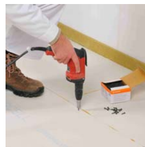
Schroeven van de liplas binnen 10 minuten...