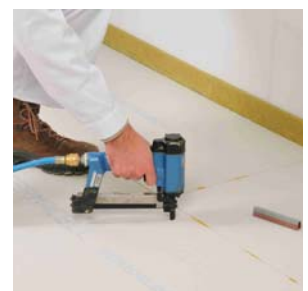
... of nieten met speciale spreidnieten, binnen 10 minuten.