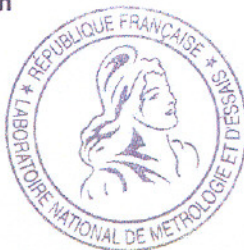
Jean Michel LAMBERT

La publication ou la reproduction de ce document n'est autorisée que sous forme intégrale - Dossier F090064- Document CQPE/14 - Page 1/1